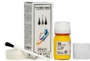
Colores para mezclas